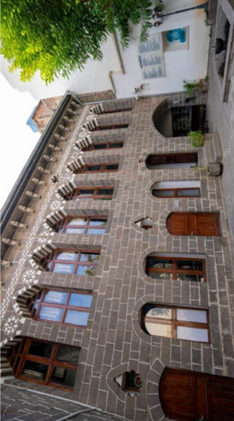
Ahmed Arif Edebiyat Müzesi